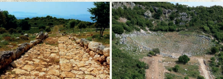
Κάθετος δρόμος προς το θέατρο / Το θέατρο / The theatre Narrow street leading to the theatre

Εναλλακτικά, και αφού έχει δει την αρχαία Αγορά , ο επισκέπτης μπορεί να αποκτήσει πληρέστερη εικόνα του χώρου και της πολεοδομικής του οργάνωσης ακολουθώντας έναν από τους κάθετους δρόμους, στα δυτικά του Καταγωγίου . Ο δρόμος οδηγεί στη βόρεια κύρια οδό (πλατεία) , τη δεύτερη κεντρική λεωφόρο της αρχαίας πόλης. Εκατέρωθεν της βόρειας κύριας οδού, όπως και στην κεντρική, διακρίνονται κάθετοι δρόμοι, κατάλοιπα οικιών και αγωγών (περιστάσεις) . Οι αγωγοί χώριζαν κατά μήκος τις οικοδομικές νησίδες και χρησίμευαν στην απορροή των υδάτων από τους λουτρώνες και τις στέγες των σπιτιών. Στα δυτικά της βόρειας κύριας οδού κάθετος δρόμος οδηγεί προς το μεγάλο θέατρο . Το θέατρο αποτελεί ένα από τα σημαντικότερα δημόσια οικοδομήματα της πόλης. Βρίσκεται κάτω από τη ΒΔ ακρόπολη και ήταν χωρητικότητας 6.000 θεατών περίπου.