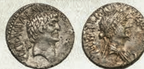
Αργυρό δηνάριο (32 π.Χ.) / Silver denarius (32 B.C.)