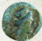
Χάλκινο νόμισμα Κασσώπης (342-330/25 π.Χ.) / Bronze coin from Kassope (342-330/25 B.C.)

Η αρχαία πόλη της Κασσώπης, πρωτεύουσα του φύλου των Κασσωπαίων, βρίσκεται στις νότιες πλαγιές του όρους Ζάλογγο, σε ένα κατάφυτο οροπέδιο με υψόμετρο 550-650μ. Ιδρύθηκε το α' μισό του 4ου αι. π.Χ. και οικοδομήθηκε σύμφωνα με οργανωμένο πολεοδομικό σύστημα. Στην ακμή της, η οποία χρονολογείται στα τέλη του 3ου αι. π.Χ., αριθμούσε 8.000-10.000 κατοίκους περίπου. Η οριστική εγκατάλειψη της πόλης επήλθε στα τέλη του 1ου αι. π.Χ., όταν οι κάτοικοί της αναγκάστηκαν να μετοικήσουν στη νεοϊδρυθείσα από τον Οκταβιανό Αύγουστο Νικόπολη.