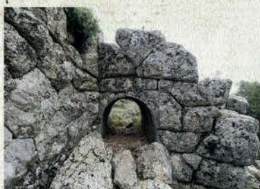
Πυλίδα στα δυτικά του τείχους / Small gate at the western side of the wall